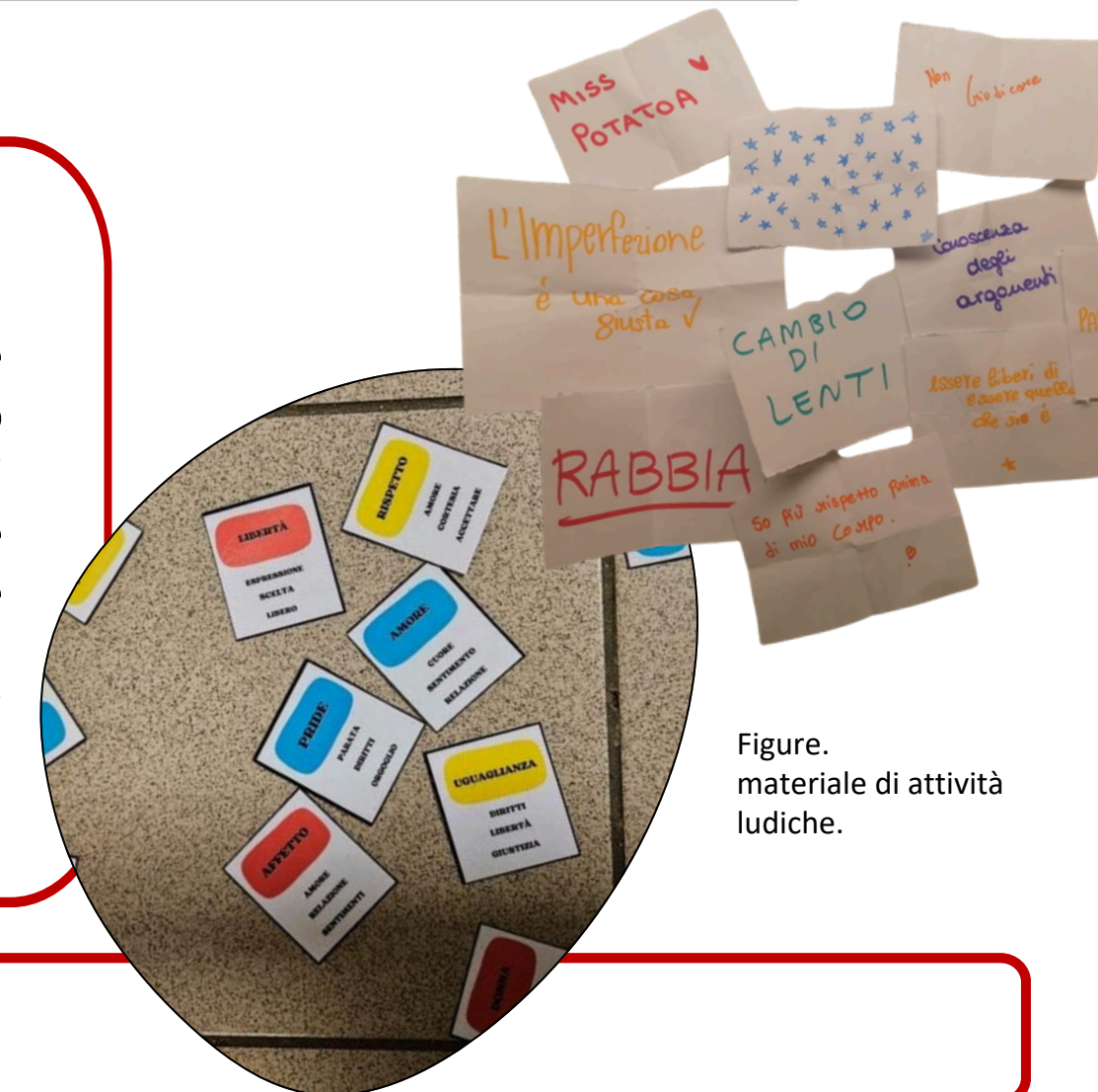
Figure. materiale di attività ludiche.

distanza e l'abilità nel leggere e accogliere le dinamiche di gruppo. Attraverso questo elaborato ho dimostrato che, nei contesti di vulnerabilità, l'Educatore Professionale non è un semplice caregiver, ma la figura strategica e abilitante che, attraverso la relazione, realizza l'obiettivo più alto: quello di fornire gli strumenti per un futuro di consapevolezza, rispetto e autodeterminazione