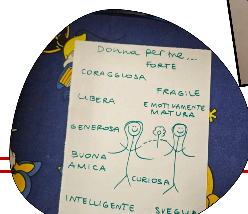
Figure. Strumenti utilizzati, materiale di attività ludiche, materiale informativo.

un "patto di partecipazione" che ha garantito un setting educativo sicuro, etico e rispettoso della privacy delle minori coinvolte.