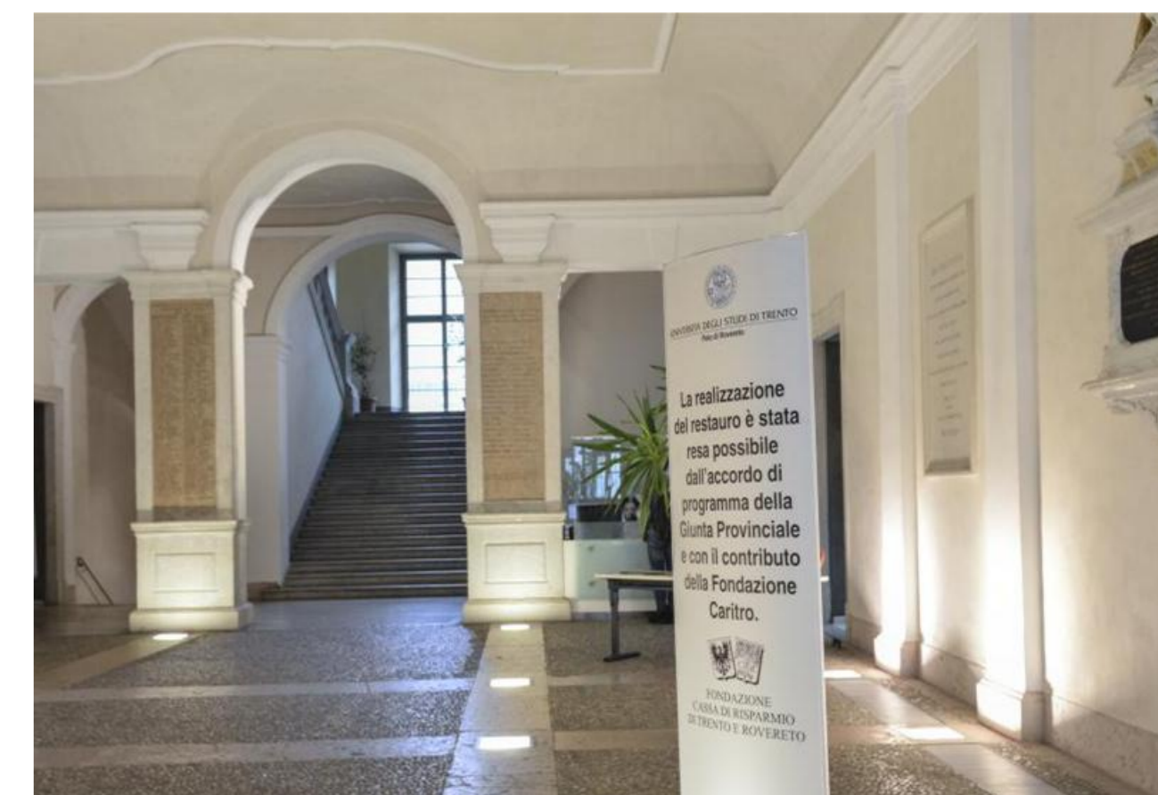
Sede Polo di Rovereto - Palazzo Piomarta - corso Bettini, 84

In questa prospettiva, il progetto educativo rappresenta lo strumento attraverso cui l'educatore esercita in modo consapevole la propria funzione professionale orientata al cambiamento.